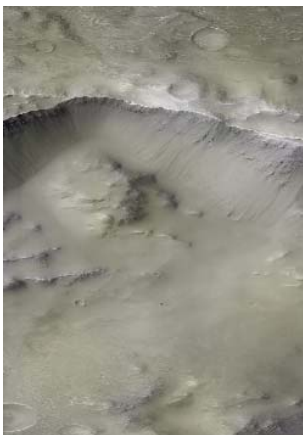
Thomas Ruff, ma.rs. 13, 2011 C-Print, 340 x 246 cm

Dienstag, 28.02.2012 um 18.00 Uhr, Haus der Kunst