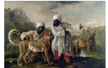
Gepard und Hirsch mit zwei indischen Wärtern 1765, Öl auf Leinwand, 180,7 x 273,3 cm, Gemalt im Auftrag von George Pigot, 1st Baron Pigot (1719-1777), Patsull Hall, Staffordshire - Manchester Art Gallery

zu den Schätzen der Royal Academy of Arts in London gehören. George Stubbs war aber auch ein herausragender Graphiker, der mit den Techniken der Radierung experimentierte und ein kleines, erstaunliches Oeuvre vornehmlich mit Darstellungen exotischer Tiere geschaffen hat. (Quelle: Homepage Neue Pinakothek, Presstext zur Ausstellung)