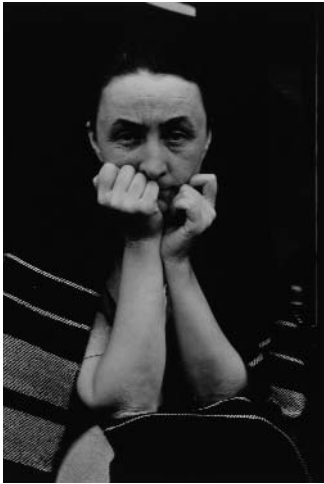
Alfred Stieglitz Georgia O'Keefe, 1935 Silbergelatine, 22,2 x 14,9 cm Georgia O'Keefe Museum, Geschenk von The Georgia O'Keefe Foundation, Santa Fe, New Mexico, © VG Bild-Kunst, Bonn 2011

Mittwoch, 15.02.2012 um 18.15 Uhr, Kunsthalle der Hypo Kulturstiftung