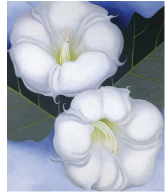
Georgia O'Keefe, Zwei Stechäpfel mit grünen Blättern und blauem Himmel, 1938 Öl auf Leinwand, 122 x 101,4 cm Privatsammlung, Schweiz © Georgia O'Keefe Museum / VG Bild-Kunst, Bonn 2011

In den 1920er Jahren revolutioniert O'Keefe die traditionelle Blumenmalerei, indem sie großformatige Bilder von Blüten malt, die sie wie durch eine Lupe gesehen aus der extremen Nahsicht zeigt. Ihre Gemälde von Gebäuden in New York, die zumeist aus derselben Zeit stammen, gelten als die amerikanischen Großstadtbilder schlechthin. Bereits 1929 verbringt sie zum ersten Mal einen Teil des Jahres im Norden New Mexicos. In ihrem Werk zeigen sich von da an ortstypische Motive: Knochen und Steine, als Fundstücke aus der Wüste, ebenso wie einzigartige geologische Formationen oder die Lehmarchitektur der indianischen Ureinwohner, sogenannte Adobe-Häuser. Ab 1949 lebt sie bis zu ihrem Tod, mit 98 Jahren, in dieser Landschaft. Ihre Bilder davon sind bis heute Inbegriff des amerikanischen Westens. (Text: Pressemitteilung Kunsthalle der Hypokulturstiftung)