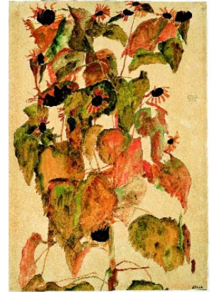
Egon Schiele Sonnenblumen, 1911 Albertina, Wien