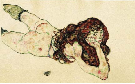
Egon Schiele, Auf dem Bauch liegender weiblicher Akt, 1917 Albertina, Wien

Samstag, 03.03.2012 um 11.30 Uhr, Lenbachhaus Kunstbau