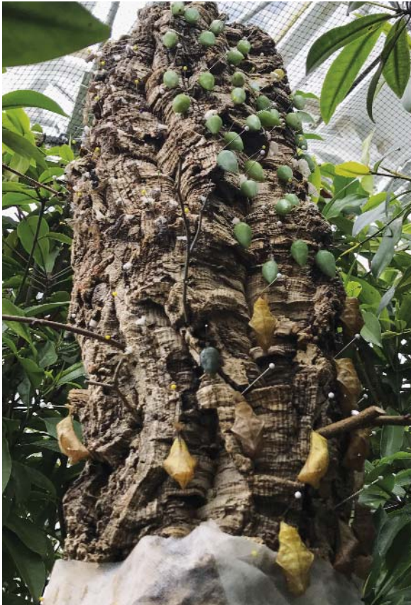
Abb.: Puppen in verschiedenen Entwicklungsstadien

Mittlerweile hat die Ausstellung der Tropischen Schmetterlinge im Botanischen Garten München schon Tradition. Seit vielen Jahren beziehen ab Mitte Dezember rund 60 verschiedene Falterarten das Wasserpflanzenhaus und begeistern große und kleine Besucher. Noch bis zum 19. März kann man den winterlichen Temperaturen kurzzeitig entfliehen und sich im „Schmetterlingshaus“ von der Farbenpracht und Vielfalt der filigranen Falter verzaubern lassen.