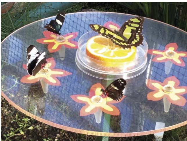
Abb.: Futterstelle mit Obst und Nektar

Wer sich Zeit nimmt und die Augen offen hält, für den gibt es viel zu entdecken. Von den Eiern über die Raupe, von der Puppe bis zum fertigen Schmetterling lässt sich hier die einzigartige Metamorphose bestaunen. Hie und da erfährt man über Plakate allerlei Interessantes und Wissenswertes.