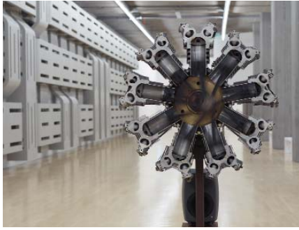
Thomas Bayrle , Monstranz, 2010, Ausstellungsansicht Foto: Städt. Galerie im Lenbachhaus u. Kunstbau, München © der Künstler und Museum Ludwig, Köln VG Bild-Kunst, Bonn 2016

Dienstag, 14.02.2017, um 16.45 Uhr: Lenbachhaus Kunstbau Führung mit Jochen Meister