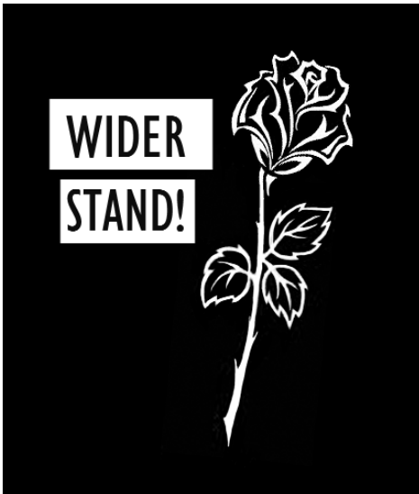
Widerstand! Illustration: C. Breitenauer

Mittwoch, 03.05.2017 – 18:00 Uhr: Friedhof am Perlacher Forst, Treffpunkt Eingang Stadelheimer Str. 24 (ggü. Tram-Haltestelle Schwannseestr., bzw. neben Parkplatz), Führung mit RAin Ingrid Oxfort