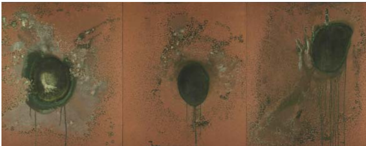
Andy Warhol, (1928 - 1987), Oxidation Painting, 1978 3 Teile, Urin auf Kupferpulver in Acryl auf Leinwand, 127 x 321,3 cm