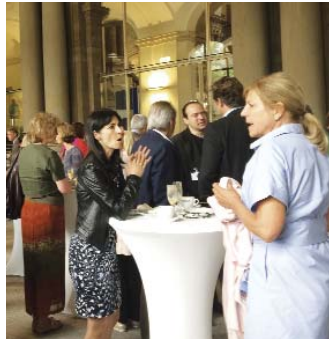
fachlich-kollegialer Austausch im Nordvestibül