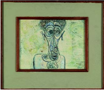
Ibrahim El-Salahi Self-Portrait of Suffering, 1961, Oil on canvas, 30,4 x 40,6 cm, Iwalewa-Haus, University of Bayreuth, Germany

Donnerstag, 24.11.2016, um 18.00 Uhr: Haus der Kunst, Führung mit Jochen Meister