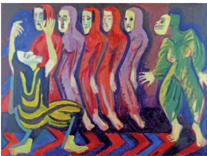
Ernst Ludwig Kirchner: Totentanz der Mary Wigman, 1926/1928, Öl auf Leinwand, Galerie Henze & Ketterer Wichtrach/Bern