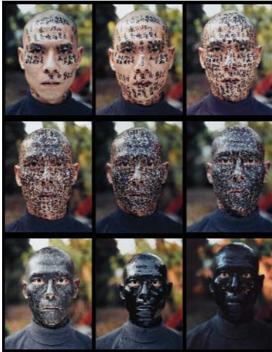
Huan Zhang | Family Tree, 2000 Collection Centre Pompidou, Paris, Musée national d'art moderne - Centre de création industrielle