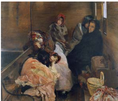
Joaquín Sorolla, Mädchenhandel, 1894, Öl auf Leinwand, 166,5 x 165 cm, Madrid, Museo Sorolla, Inv.-Nr. 320

Donnerstag, 30.06.2016 um 18.15 Uhr, Kunsthalle der Hypo-Kulturstiftung, Führung mit Dr. Ulrike Kvech-Hoppe